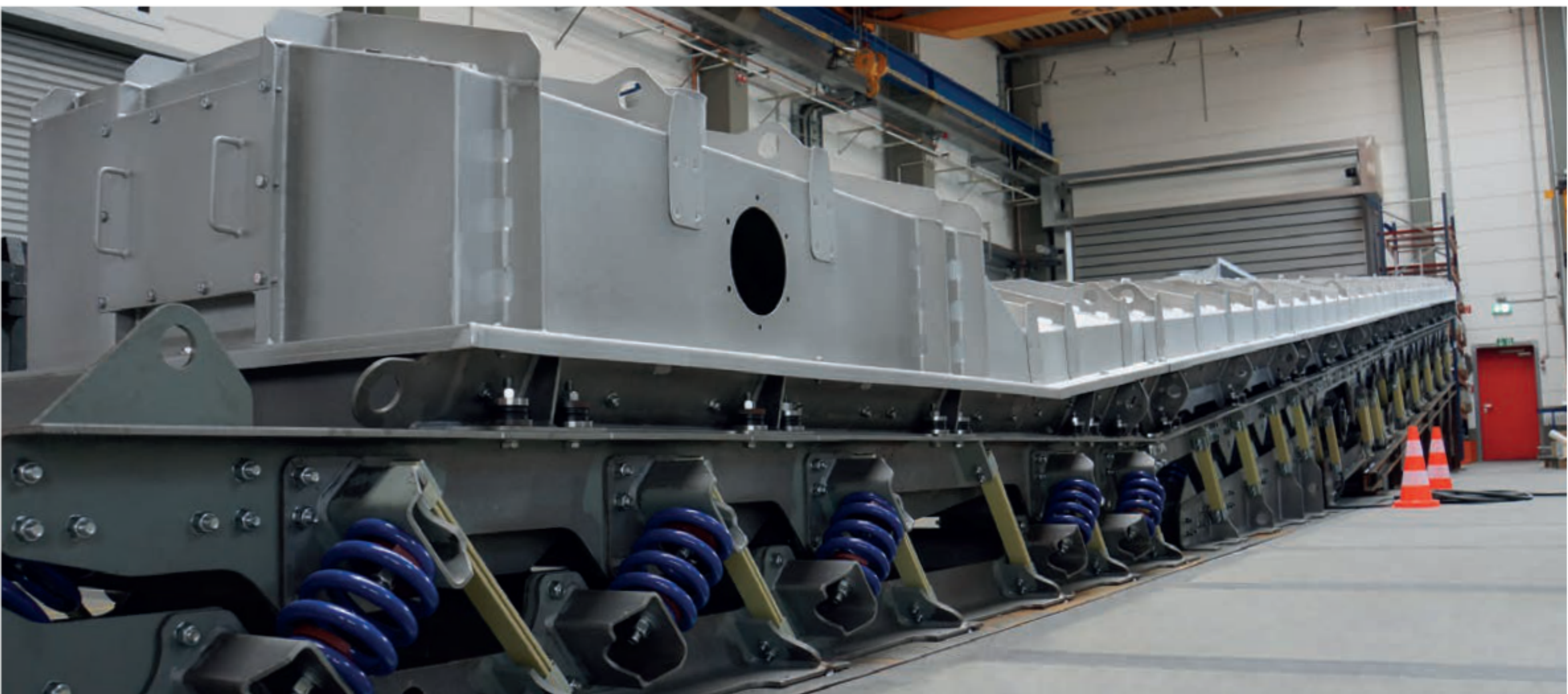
Unwuchtförderrinne / Feeder with Unbalance Motors